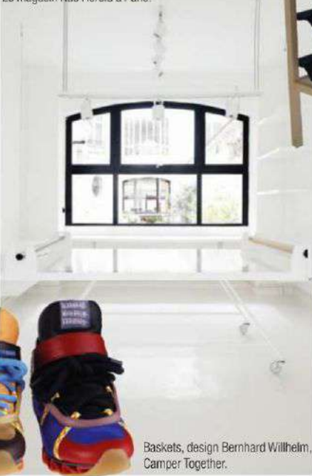
Le magasin Rue Hérold à Paris.